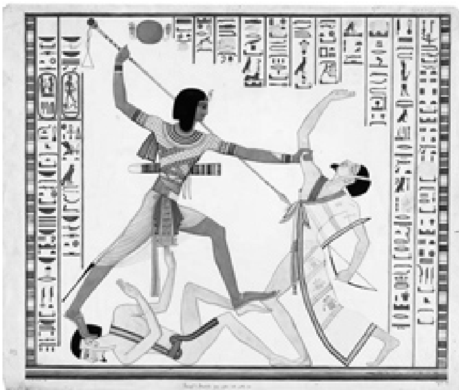
Reatto dalla mostra "Lungo il Nilo. Ippolito Rosellini e la Spedizione Franco-Toscana in Egitto (1828-1829)".